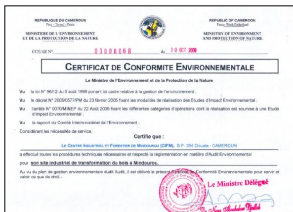
Certificat référence CCE / EIE N° 00000068 du 30 octobre 2009

Il s'agit ici de la première version (01) pour le compte du premier semestre 2023, conformément au plan de travail annuel élaboré et validé par l'administration. D'autres versions pourront éventuellement être produites en fonction des remarques suscitées par ce document.